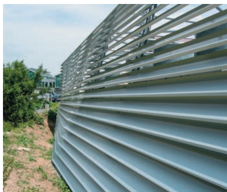
Verschiedenste Winkel und Fluchten – eine Herausforderung der besonderen Klasse. Différents angles et alignements – un défi d'une classe particulière.

Nach der Aufrichtung des Stahlbaus sind die Lamellenkonsolen angebracht, ausgerichtet und provisorisch fixiert worden. Die jeweilige Einteilung resultiert, wie bereits erwähnt, aus der Division «Stützenlänge durch Anzahl Lamellen». Anschliessend wurden die Lamellenbänder aneinandergereiht. Die Montage erfolgte immer horizontal umlaufend. Die genaue Ausrichtung ist von Auge und allenfalls mit Hilfe von Richtschnüren vollzogen worden. ■