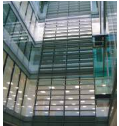
Blick von unten: Die stirnseitig angebrachten Aluminiumlamellen verhindern die Blendwirkung. Vue de dessous : les lamelles en aluminium à l'avant empêchent tout éblouissement.

Vertikalschnitt durch den Bodenbereich. Die winkelförmige Deckleiste markiert die Horizontale. Die Profilierung ist eine Eigenentwicklung. Die Gläser weisen aussen einen Siebdruck auf.