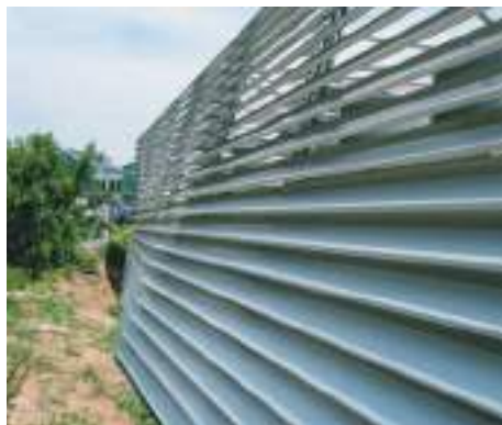
Verschiedenste Winkel und Fluchten – eine Herausforderung der besonderen Klasse. Différents angles et alignements – un défi d'une classe particulière.

Nach der Aufrichtung des Stahlbaus sind die Lamellenkonsolen angebracht, ausgerichtet und provisorisch fixiert worden. Die jeweilige Einteilung resultiert, wie bereits erwähnt, aus der Division «Stützenlänge durch Anzahl Lamellen». Anschliessend wurden die Lamellenbänder aneinandergereiht. Die Montage erfolgte immer horizontal umlaufend. Die genaue Ausrichtung ist von Auge und allenfalls mit Hilfe von Richtschnüren vollzogen worden. ■